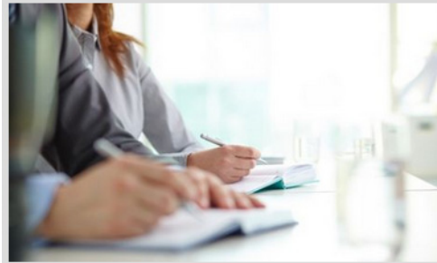
Al via i corsi di formazione del consorzio Zenit