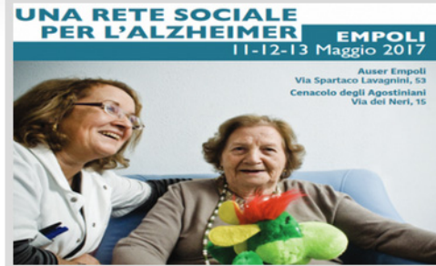
Una rete sociale per l'Alzheimer: continuano le giornate dedicate alla demenza l'11, il 12 e 13 maggio a Empoli